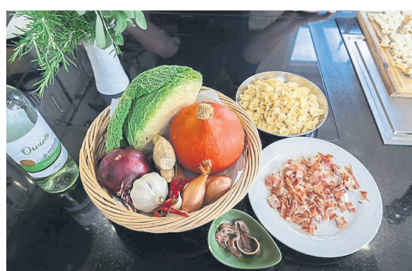
Das Gericht stammt ursprünglich aus Apulien: Orecchiette mit Wirsing und Kürbis.

2 altbackene Semmeln oder 3 Scheiben Toastbrot Kräuterbutter zum Anbraten 500 g Wirsing 400 g Hokkaido-Kürbis Olivenöl 2 Knoblauchzehen 100 g Speckwürfel 4 Sardellenfilets in Öl 1 rote Chilischote 200 ml Weißwein 200 ml Gemüsebrühe ½ Zitrone, Abrieb Meersalz Pfeffer Kreuzkümmel Muskat 350 g Orecchiette