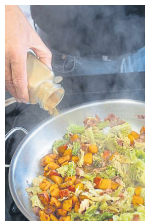
Würzen: Maurer spart nicht mit Kreuzkümmel.